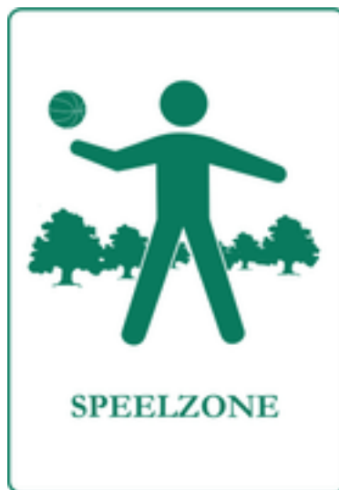
Afbeelding 12: Scoutsbos