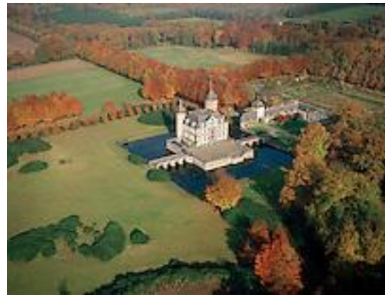
Afbeelding 16: Kasteel van 's-Gravenwezel