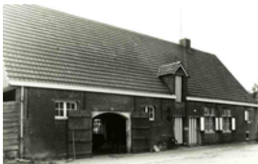
Afbeelding 9: Schranshoeve

Oorspronkelijk woonstalhuis (nok parallel aan de straat) binnen omheind terrein met aantal 20ste-eeuwse bijgebouwen aan zuid- en oostzijde.