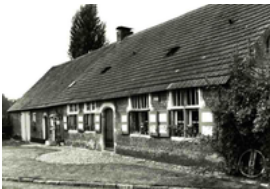
Afbeelding 11: Kattenberghoeve

Hoeve met losstaande bestanddelen uit de 18de eeuw op omheind domein. Gelegen op enige afstand van de straat en ermee verbonden door een onverharde weg. Woonstalhuis (nummer 36), (nok loodrecht op de straat), tot woning verbouwde schuur (nummer 34), (nok loodrecht op de straat) aan westzijde, en bakhuis (nok loodrecht op de straat) aan noordoostzijde.