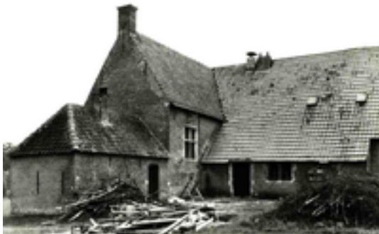
Afbeelding 19: Duyvendaelhoewe

Hoeve met losstaande bestanddelen op afgepaald terrein met aarden erf. In omgeving weiland. Vermoedelijk van circa 1720 met oudere kern en werd mogelijk ook aangeduid onder de benamingen Grote Stede, Grote Hoeve en Grote Bergse hoeve. L-vormig woonstalhuis (nok loodrecht op de straat) met woonhuisgedeelte uit de 17de eeuw (?) en het eerste kwart van de 18de eeuw (?) en stalling uit de 19de en de 20ste eeuw (?), langsschuur (nok loodrecht op de straat) uit het eerste kwart van de