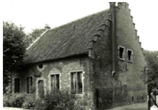
Afbeelding 17: Woning Flinckheuvel

"Flinckheuvel" volgens recent uithangbord. Sterk verbouwde alleenstaande woning (nok parallel aan de straat) op deels ommuurd en omheind domein. Rechthoekig gebouw met zuidelijke voorgevel van drie traveeën en één bouwlaag onder zadeldak (Vlaamse pannen), met kern uit de 18de eeuw volgens jaartal 1779 op sluitsteen deur. Brandde gedeeltelijk af in 1949.