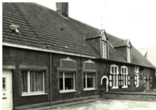
Afbeelding 13: Molenhoeve

Gedeelte van zogenaamde Molenhoeve met ommuurde voortuin. Voormalige molenaarswoning en hoeve bij de in 1908 verdwenen molen. Vermoedelijk daterend van circa 1770. Heden verbouwd tot twee woningen, met behoud van oorspronkelijk uitzicht bij nummer 34.