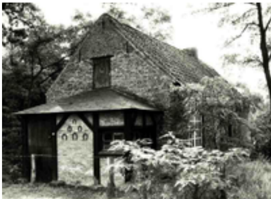
Afbeelding 23: Smidse

Voormalige smidse, heden verbouwd tot woning; omheind en met gras begroeid domein. Rechthoekig gebouw van heden vier traveeën en één bouwlaag onder zadeldak (nok loodrecht op de straat, Vlaamse pannen), uit het vierde kwart van de 19de eeuw (?). Vermoedelijk vergroot met één travee aan zuidzijde zie bouwnaad.