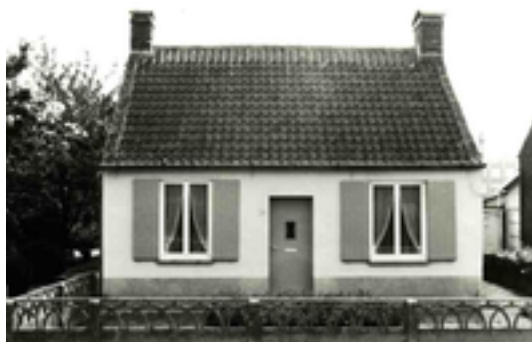
Afbeelding 8: Dorpswoning

Kleine alleenstaande dorpswoning van het dubbelhuistype; omheind voortuintje. Westelijke voorgevel van drie traveeën en één bouwlaag onder zadeldak (Vlaamse pannen), uit de eerste helft van de 19de eeuw (?).