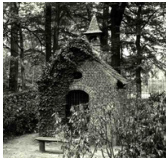
Afbeelding 21: Kapel van de overbuur

Als Onze-Lieve-Vrouwekapel ingericht gemeenschappelijk bakhuis uit de tweede helft van de 18de eeuw (?). Gelegen op terreintje afgesloten