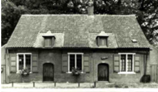
Afbeelding 22: Dorpswoningen Ter Brakken

Ter Brakken volgens recent houten naambord. Rechthoekig gebouw van 1778 (zie sluitsteen van de linker deur) met omhaagde tuintjes aan oost- en westzijde, met ronde gecementeerde waterput met wip aan oostzijde; grenzend aan domein van zogenaamd Catershof.