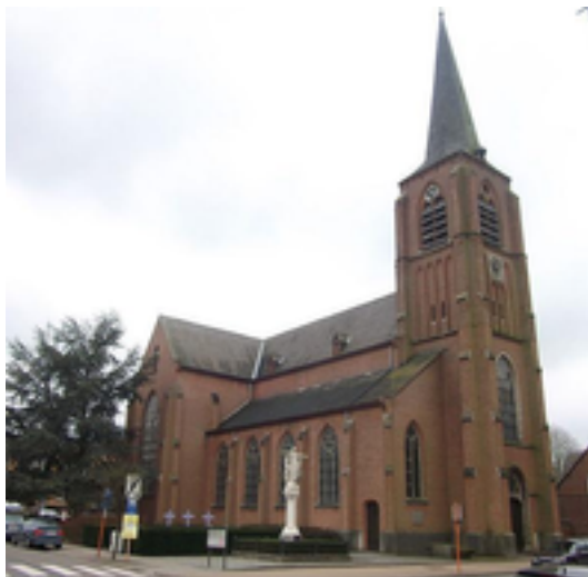
Afbeelding 2: Sint-Catharinakerk

De Sint-Catharinakerk is een parochiekerk in 's-Gravenwezel, een deelgemeente van de Vlaamse gemeente Schilde.