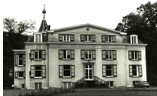
Afbeelding 20: Kasteel Catershof

Kasteel, grotendeels uit de 19de eeuw, met aanhorigheden. Gelegen in sterk beboomd domein. Ontstaan in de 15de eeuw, grondig verbouwd in de 17de eeuw. Heden met 19de-eeuws uitzicht. Enkel de toren aan oostgevel heeft een oudere kern.