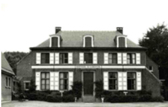
Afbeelding 6: Rusthuis Sint-Lodewijk (, 17-05-1976,)

"Rusthuis Sint-Lodewijk", zie beschilderd opschrift op geschilderde fries bij borstwering. Achterin gelegen oorspronkelijk alleenstaand dubbelhuis van vijf traveeën en twee bouwlagen onder schilddak (leien) met drie steekboogvormige dakvensters, jaartal 1782 bij kroonlijst deur. Sinds 1928 ingericht als rusthuis.