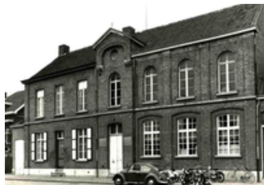
Afbeelding 5: Gemeentehuis van 's Gravenwezel en school