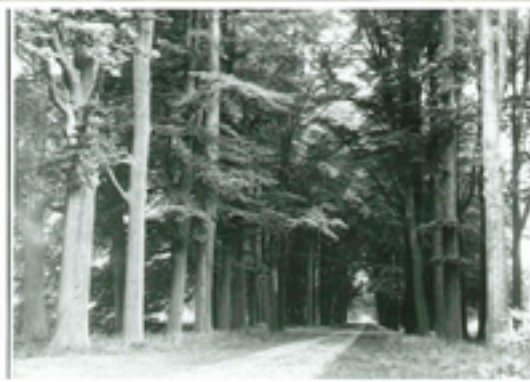
Afbeelding 18: Dreef bij Kasteel van 's Gravenwezel

bomen ligt in het verlengde van de Kerkstraat en leidt naar de toegangsdreef tot het ten zuiden van de dreef gelegen Kasteel van 's Gravenwezel, een vierkant waterkasteel uit de 15de-17de eeuw. Vandaar vormt de dreef een hoek naar het noorden toe en vormt zo de verbinding tussen het kasteel en Sint-Job-in-'t Goor. Het tracé van de dreef is reeds duidelijk herkenbaar op de kabinetskaart van de Ferraris (1770-1778).