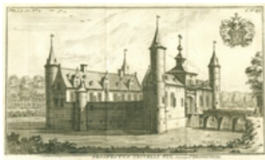
Afbeelding 1: 's-Gravenwezel (Bron: uitgever: Jean Neaulme, gravure: Harrewijn)

's-Gravenwezel is een deelgemeente van de gemeente Schilde in de Belgische provincie Antwerpen. 's-Gravenwezel was een zelfstandige gemeente tot einde 1976. 's-Gravenwezel heeft een oppervlakte van 14,95 km 2 en telde in 2006 6358