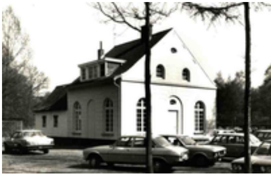
Afbeelding 14: Jachtpaviljoen bij Kasteel van 's Gravenwezel