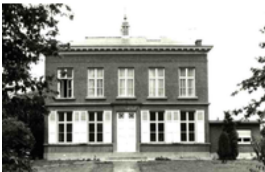
Afbeelding 7: Pastorie Sint-Catharinaparochie

Alleenstaand herenhuis van het dubbelhuistype, binnen deels ommuurd en omhaagd, beboomd domein met toegangspoort voorzien van bakstenen pijlers en ijzeren hek.