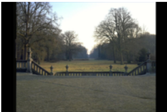
Afbeelding 15: Domein Catershof en Kasteel van 's Gravenwezel

Het landschap gevormd door het Domein Katershof en het Kasteel van 's Gravenwezel is gelegen op grondgebied van 's Gravenwezel, een deelgemeente van Schilde in de Antwerpse Kempen. De begrenzing wordt gevormd door De Haar en de gehuchten Willekom en Hoge Haar in het oosten, de Gilles de Pelichylei in het zuiden, het gehucht Molenveld in het westen en het gehucht Zonnebos, de Sint-Jobsesteenweg en de Antitankgracht in het noorden.