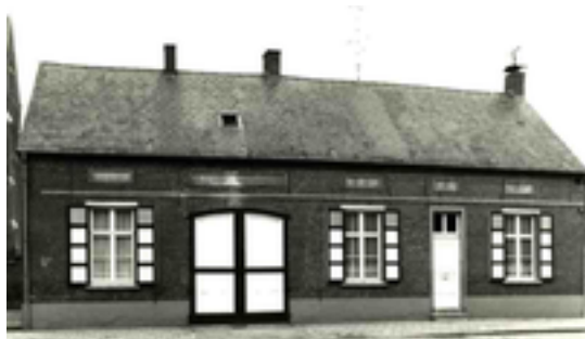
Afbeelding 3: Dorpswoning

Alleenstaande dorpswoning gelegen rechts van de kerk; mogelijk uit de 18de eeuw en vermoedelijk verbouwd in het vierde kwart van de 19de eeuw (?) en de 20ste eeuw. Voormalige kosterswoning, tot 1878 eveneens gebruikt als gemeenteschool. Vermoedelijk in het vierde kwart van de 19de eeuw bepleisterd en voorzien van nieuwe muuropeningen zie aantal sporen van gedichte muuropeningen.