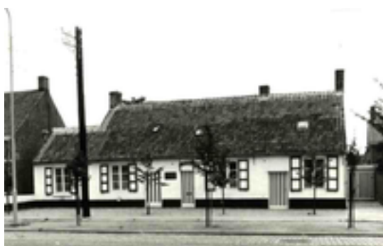
Afbeelding 4: Twee dorpswoningen

Gegroepeerde dorpswoningen van zes traveeën en één bouwlaag onder zadeldak (Vlaamse pannen); aangebouwde eerste travee onder lager dak, uit de 19de eeuw. Heden museum en vergaderlokaal van de heemkring "De Drie Rozen".