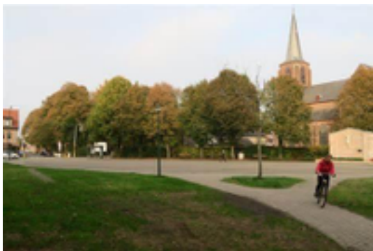
Afbeelding 10: Dorpscentrum 's-Gravenwezel

Dorpscentrum van 's-Gravenwezel (Lodewijk de Vochtplein) met een groene omgeving.