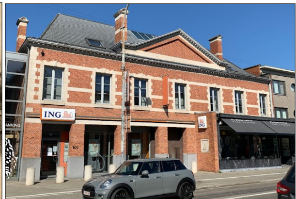
Hotel Keizershof vroeger en nu